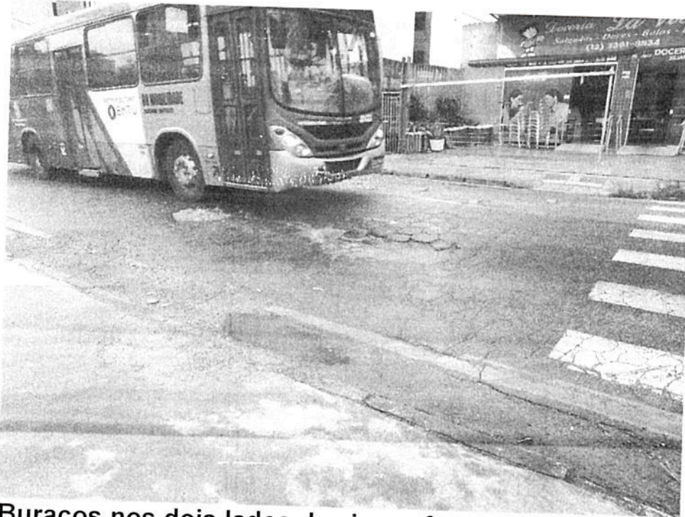
Buracos nos dois lados da via em frente ao nº 296.

484º Ano da Fundação do Povoado e 68º de Emancipação Político Administrativa