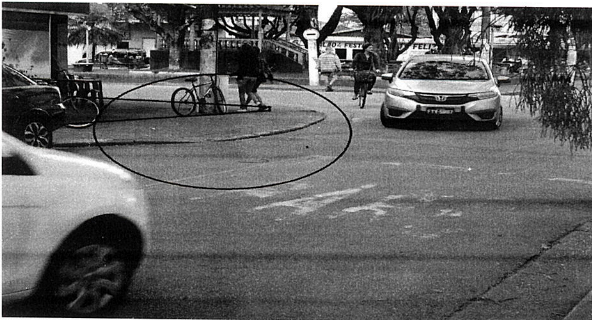
Raio da Curva - Via de Mão Dupla